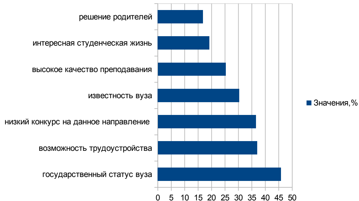
Рисунок -1. Мотивы выбора СКГМИ (ГТУ)

Из рисунка 1 наблюдаем, что для 45,83 % мотивом поступления является государственный статус ВУЗа, для 36,93 % – возможность трудоустройства, для 36,5 % – низкий конкурс на выбранное направление, для 30,3 – известность и престиж ВУЗа, для 25,24 % – высокое качество преподавания, для 19,2 % – интересная студенческая жизнь, для 16,79 % – выбор друзей/однокурсников и для 13,79 % решение родителей.