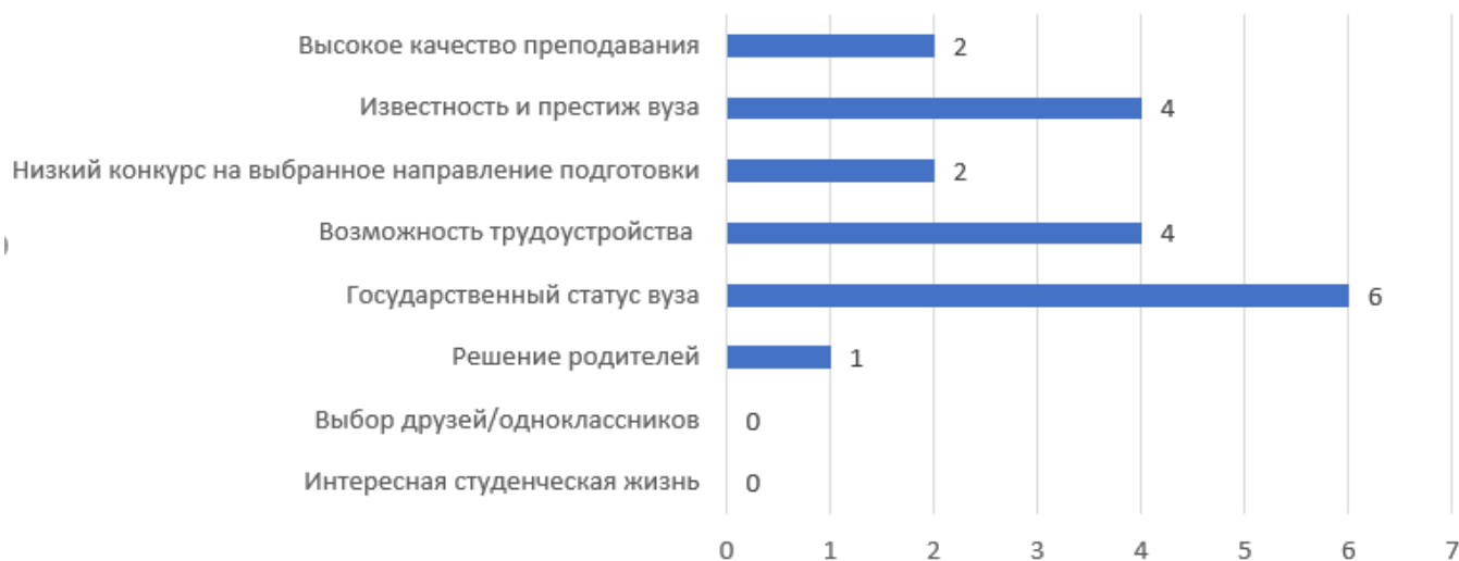
Рисунок -1. Мотивы выбора СКГМИ (ГТУ)

На вопрос «Каковы были мотивы выбора СКГМИ (ГТУ) были даны следующие ответы, представленные на рисунке 1.